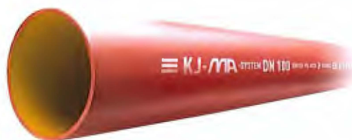
Fig. 1 KJ-MA® Avløpssystem – MA-rør Figur: Gustavsberg Rørsystem AB

Systemet kan også benyttes til bortledning av innvendig overvann, men slike installasjoner er ikke beskrevet i denne godkjenningen.