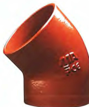
Fig. 2 KJ-MA® Avløpssystem – Bend 45°