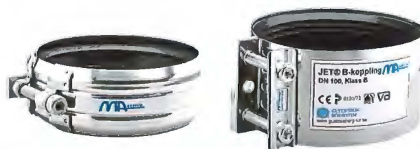
Fig. 3 KJ-MA® Avløpssystem – Koblinger Figur: Gustavsberg Rørsystem AB

SINTEF er norsk medlem i European Organisation for Technical Assessment, EOTA, og European Union of Agrément, UEAtc